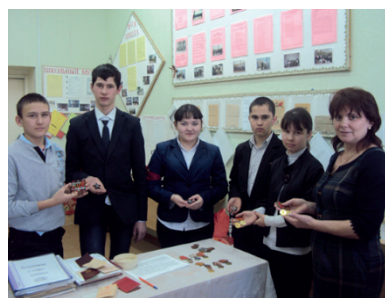
Подготовка страницы Книги Памяти