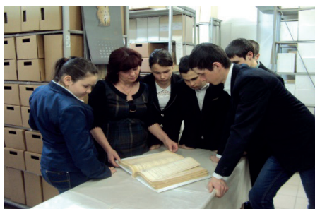
Работа в районном архиве

Проект отражает необходимый обществу и государству социальный заказ на воспитание гражданина своей Родины, патриота с активной жизненной позицией.