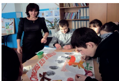
Подготовка к конкурсу