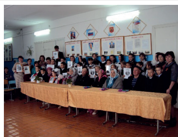
Презентация книги Памяти